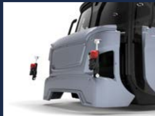
Adaptive HYDAC Kabinenfederung