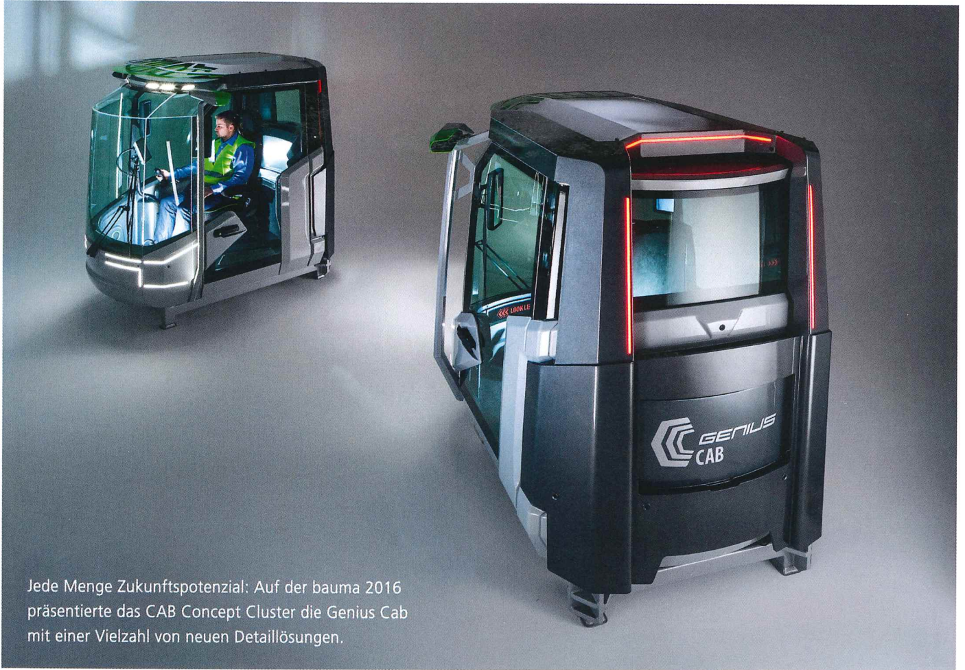
Jede Menge Zukunftspotenzial: Auf der bauma 2016 präsentierte das CAB Concept Cluster die Genius Cab mit einer Vielzahl von neuen Detaillösungen.